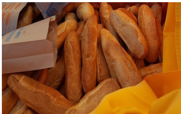
Curso de Padaria e Confeitaria

Em todos os cursos da qualificação profissional-confeiteiro existe uma parte teórica acompanhada obviamente da respectiva da parte prática. Dessa forma, todos os produtos produzidos são direcionados diariamente para a doação/ consumo dos próprios alunos do Centro de Educação Infantil Batuíra e dos alunos dos cursos profissionalizantes, além das pessoas que são atendidas pelos programas Sopa Fraterna e Família Assistida e até mesmo moradores em situação de rua atendidos pela unidade Lar Transitório e pelo projeto Ronda Noturna, bem como servidos nas refeições dos funcionários da entidade.